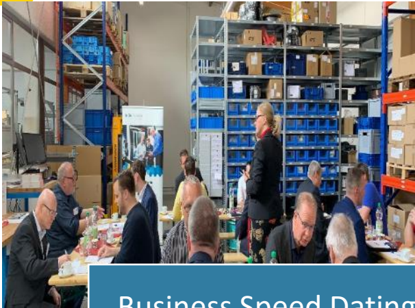
Business Speed Dating